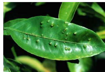
そうか病 いぼ型病斑