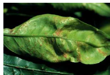
そうか病 そうか型病斑